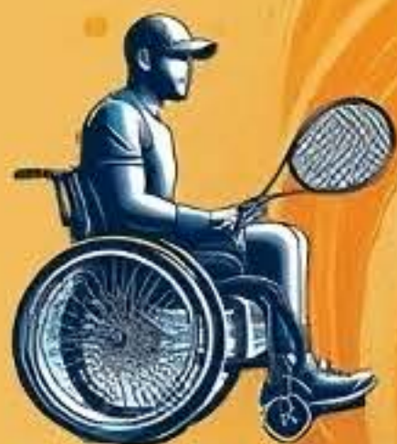
TENNIS / TENNIS FAUTEUIL