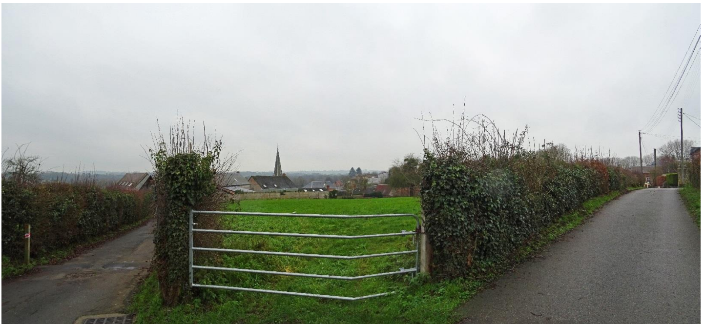
Illustration de la vue :