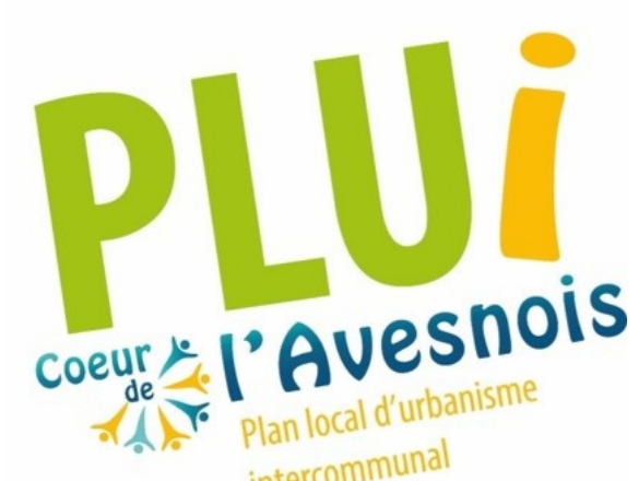
PLANCHE B - CENTRE BOURG - PLAN DE ZONAGE Commune de Floursies