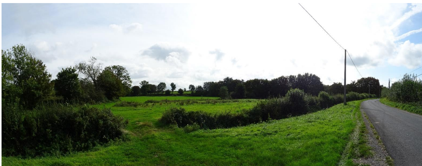
Illustration de la vue