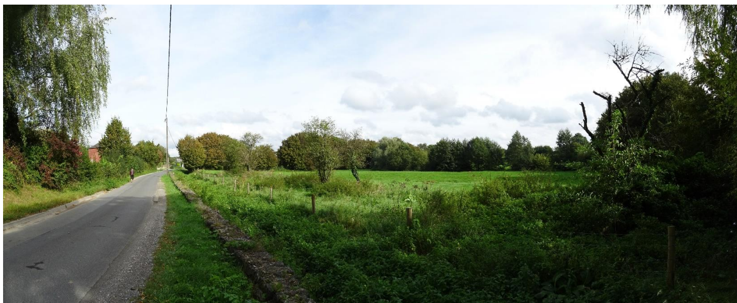
Illustration de la vue