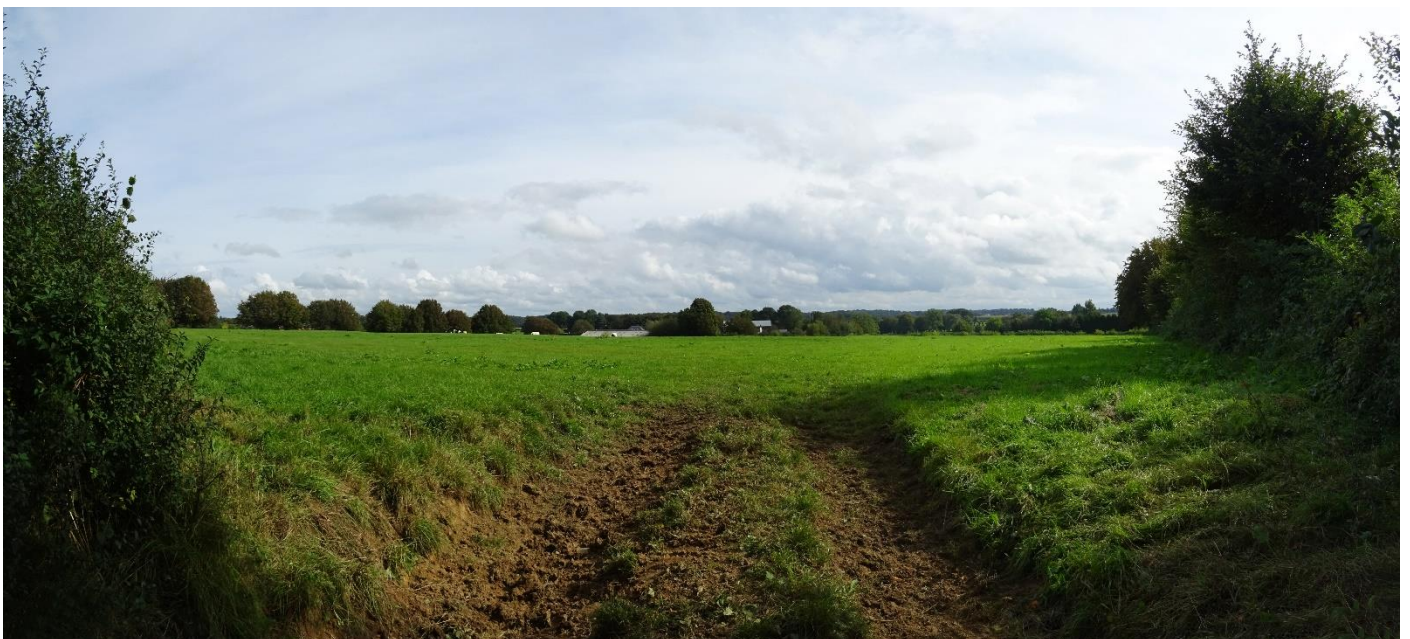
Illustration de la vue