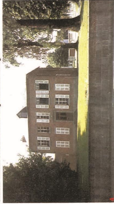
4 Parc Lamborelle - Chateau Michel PECQUERIAUX - rue Jean-Baptiste Lebas