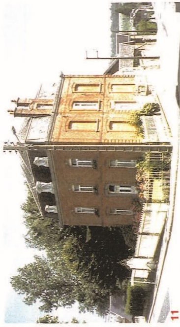
11 Chateau du Docteur MARTIN - Angle de la rue Salengro