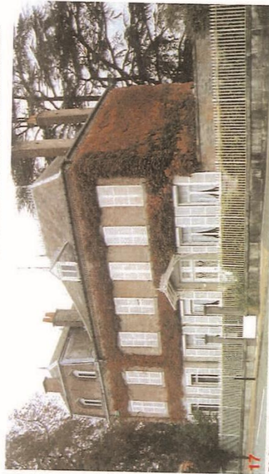
17 Château Ernest PECQUERIAUX - rue Sadi Carnot