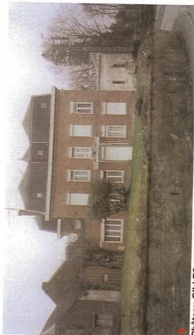
8 Château GILLES - rue du Docteur Chevallier