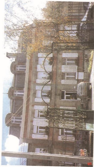
5 Administration du Collège agricole - Château FOSSE - rue Jean-Baptiste Lebas