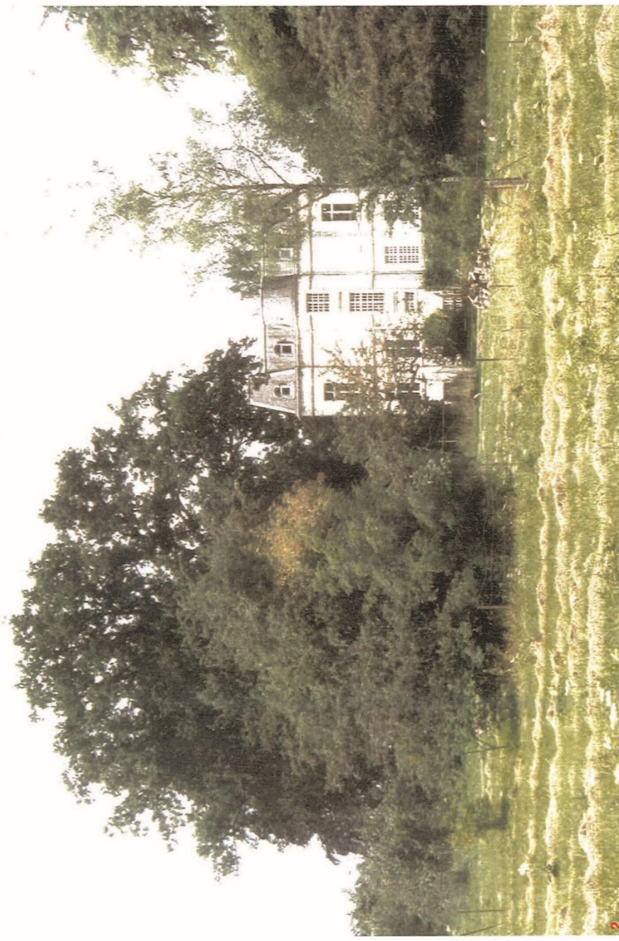
2 Chateau Maurice PECQUERIAUX - Angle de la rue Salengro