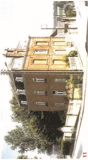
11 Château du Docteur MARTIN - Angle de la rue Salengro