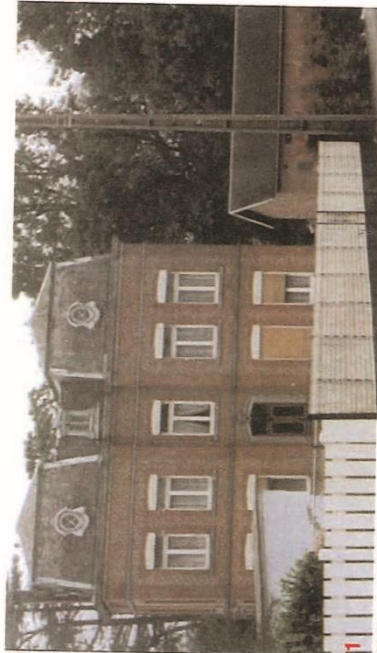
Château STAVEAU - rue Jean-Baptiste Lebas