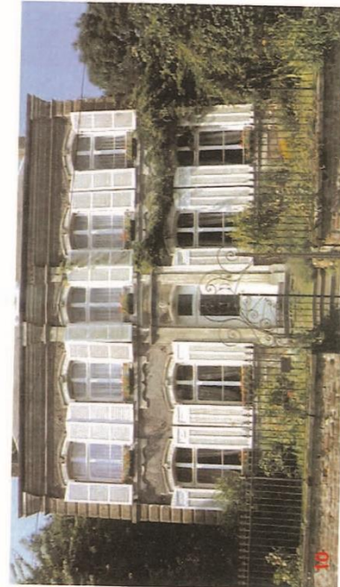
Château Ernest PEQUERIAUX - rue Sadi Carnot