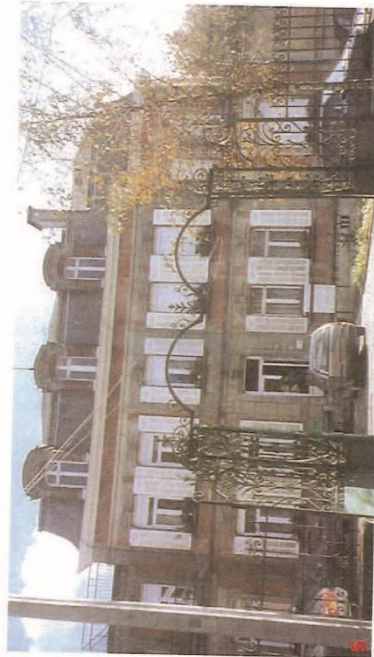
Administration du Collège agricole - Château FOSSE - rue Jean-Baptiste Lebas