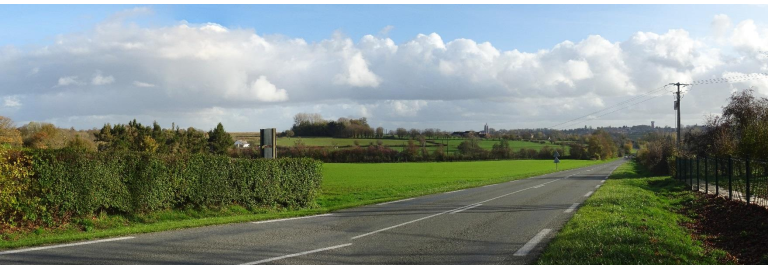
Illustration de la vue :