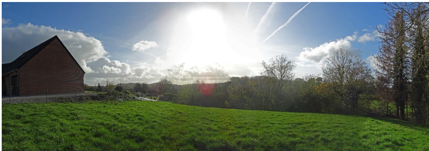
Illustration de la vue :